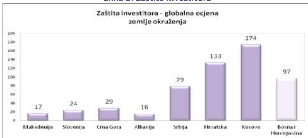
Slika 8: Zaštita investitora

Indeks obima otkrivanja bavi se transparentnošću transakcija prema javnosti i dioničarima, obavještavanjem dioničara o urađenim transakcijama, te mogućnošću sprečavanja problematičnih transakcija da se uopšte dese. Indeks odgovornosti direktora pokazuje zaštitu investitora od štete koju direktor i uprava firme mogu učiniti i način da se odgovorni efikasno kazne, te da se investitori novčano obeštete zbog nemara i lošeg rada menadžmenta kompanija. Indeks lakoće tužbe dioničara pokazuje kolika je raspoloživost dokumenata koji mogu biti korišteni prilikom suđenja, kolika je mogućnost investitora da saslušaju svjedoke i kakva je saradnja sa inspeksijskim službama da se istraže sumnjive transakcije i odluke.