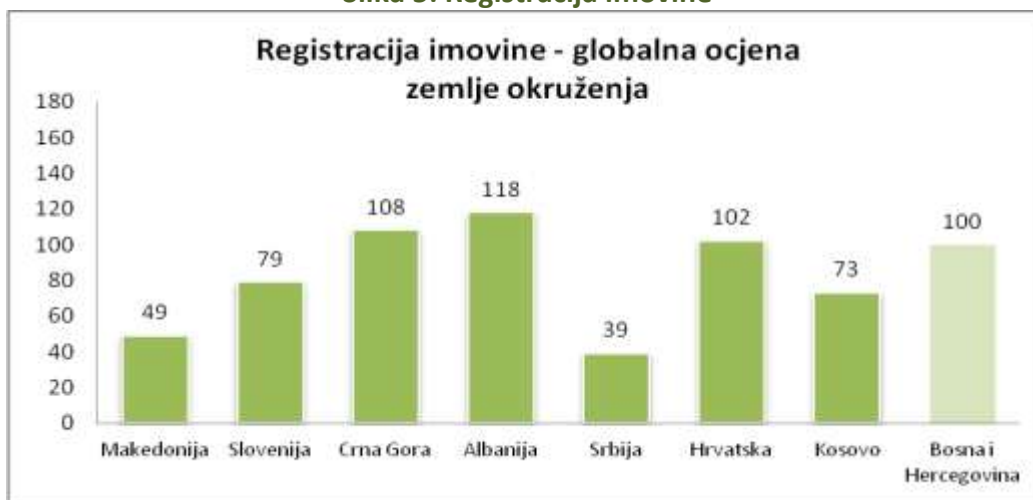
Slika 5: Registracija imovine

Imovina preduzeća olakšava priliv investicija i omogućava poduzetnicima pristup kreditima na finansijskim tržištima. Ali veliki dio imovine preduzeća u zemljama u razvoju nije formalno registrovan. Imovina nije evidentirana u sudskim i katastarskim knjigama i ne može se koristiti kao osiguranje prilikom dobijanja kredita što ograničava finansiranje poslovanja. Eliminisanje neophodnih prepreka za registraciju i transfer imovine je veoma važno za ekonomski razvoj.