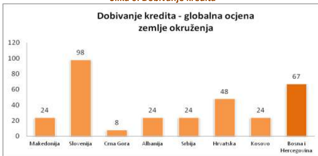
Slika 6: Dobivanje kredita

Širenjem kreditnih informacija, pomaže se kreditorima da procijene rizik i alociraju kredit efikasnije. Oni takođe sprečavaju poduzetnike da se oslanjaju na same lične veze kada pokušavaju da dobiju kredit.