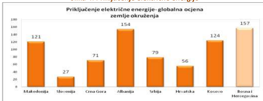
Slika 4: Priključenje električne energije