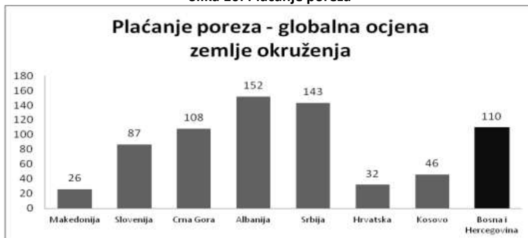
Slika 10: Plaćanje poreza

Porezi su izuzetno bitni za svaku zemlju. Bez njih ne bi bilo novca da se obezbijedi zadovoljenje javnih potreba, ulaganje u infrastrukturu i usluge koje su ključne za funkcionisanje ekonomije. Ukoliko je poresko opterećenje visoko i zakonska regulativa rigidna, preduzetnici će težiti ka radu u sivoj (neformalnoj) ekonomiji.