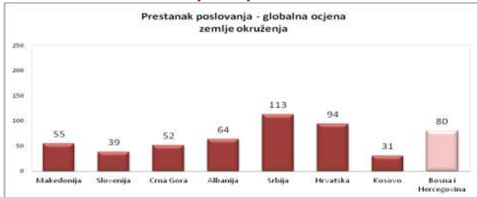
Slika 13. Rješavanje insolventnosti

Dobro balansirani sistemi stečaja razlikuje kompanije koje su finansijski propale, ali ekonomski egzistiraju na račun neefikasnih kompanija koje bi trebale biti likvidirane. Ali u nekim sistemima u slučaju insolventnosti, čak se i kompanije koje mogu raditi ukidaju. Ovo je početak da se to promijeni. Mnoge prethodne reforme zakona o stečaju su imale za cilj da pomognu da se poslovanje firmi ili perspektivnih dijelova firmi nastavi.