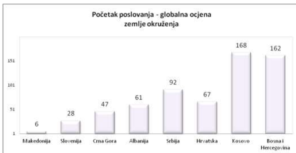
Slika 2: Početak poslovanja

Kada poduzetnici naprave poslovni plan i pokušaju da ga realizuju, prva teškoća s kojom se suočavaju su zahtijevane procedure da registruju novu firmu prije nego što počnu zakonski raditi. Ekonomije se razlikuju uglavnom po tome kako regulišu ulazak u biznis (početak novog poslovanja). U nekim, proces je jasan i primjenljiv. U drugim ekonomijama, procedure su teške i dugotrajne tako da poduzetnici moraju podmititi službenike kako bi ubrzali proces ili bi se mogli odlučiti da pokrenu neformalnu ekonomiju.