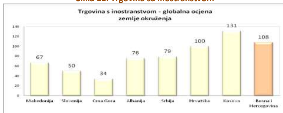
Slika 11: Trgovina sa inostranstvom

U ovom poglavlju su obrađeni prihodi od trgovine i prepreke u trgovini. Tarife, kvote i udaljenost od velikih tržišta uveliko povećavaju trošak dobara i štete razvoju trgovine. Globalni i regionalni trgovinski aranžmani su smanjili trgovinske barijere. Udio Afrike u globalnoj trgovini je manji danas nego što je bio 25 godina prije. Da li je isto tako i sa Bliskim Istokom, isključujući izvoz nafte? Mnogi poduzetnici se suočavaju sa brojnim teškoćama u izvozu ili uvozu dobara, uključujući kašnjenja na granici. Zbog toga oni često odustanu od spoljnotrgovinske razmjene. Drugi, nikad i ne pokušavaju. U stvari, potencijalne dobiti od trgovinskih olakšica mogu biti veće nego one koje proističu iz samih tarifnih olakšica.